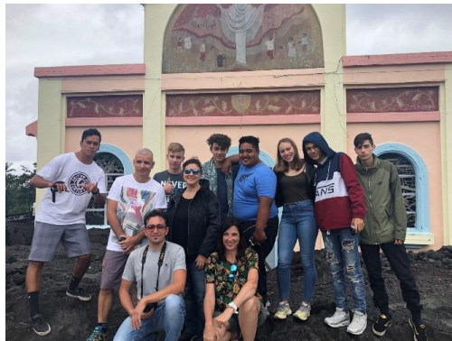
La Réunion 07/11/18- 21/11/18