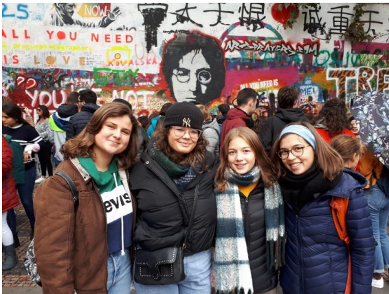
Šternberk 04/10/2019- 11/10/2019