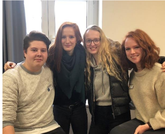
Saint-Amand 18/02/2018- 23/02/2018