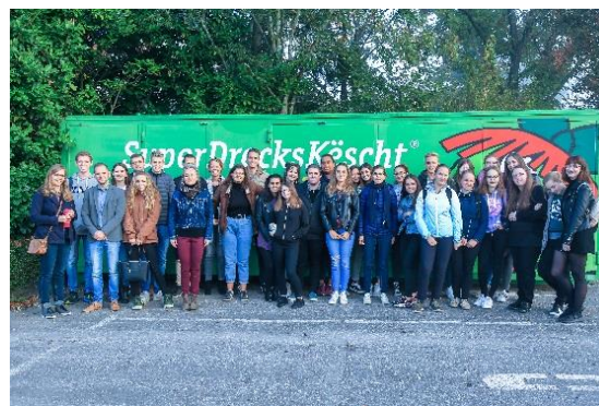
Diekirch 08/10/2018- 12/10/2018