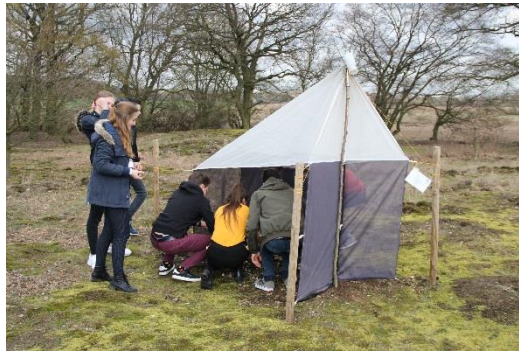
Mönchengladbach 18/03/2019- 22/03/2019