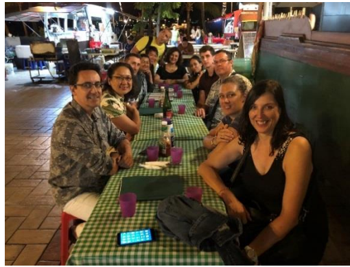
Tahiti 19/09/18- 30/09/18