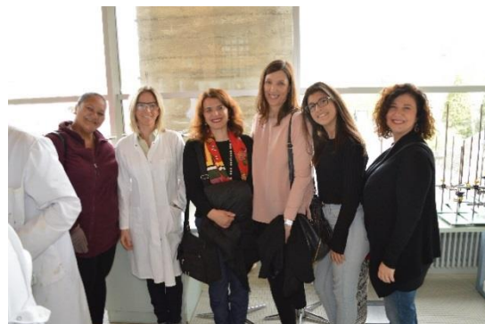
Tahiti 14/01/18- 01/02/18