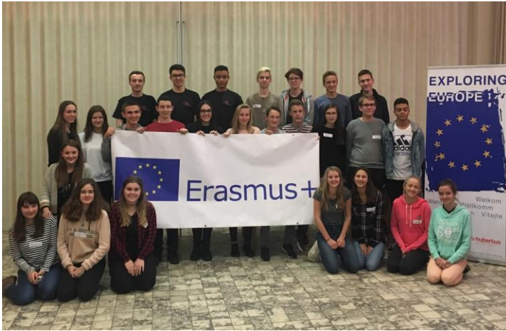
Neerpelt 26/11/2017- 01/12/2017