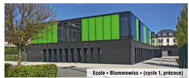
Ecole « Blummewiss » (cycle 1, précoce)