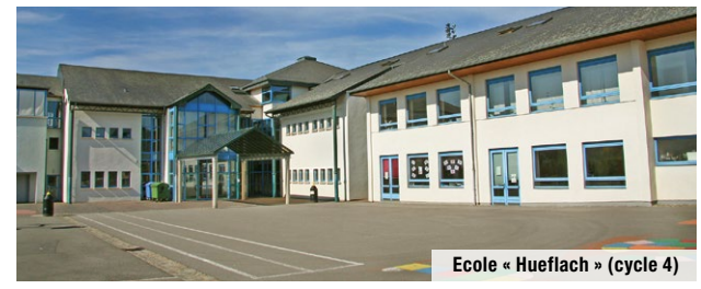
Ecole « Hueflach » (cycle 4)