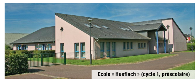
Ecole « Hueflach » (cycle 1, préscolaire)